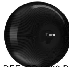
REF: CP-5006-BL Acabado NEGRO