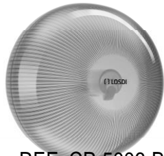
REF: CP-5006-B Acabado BLANCO